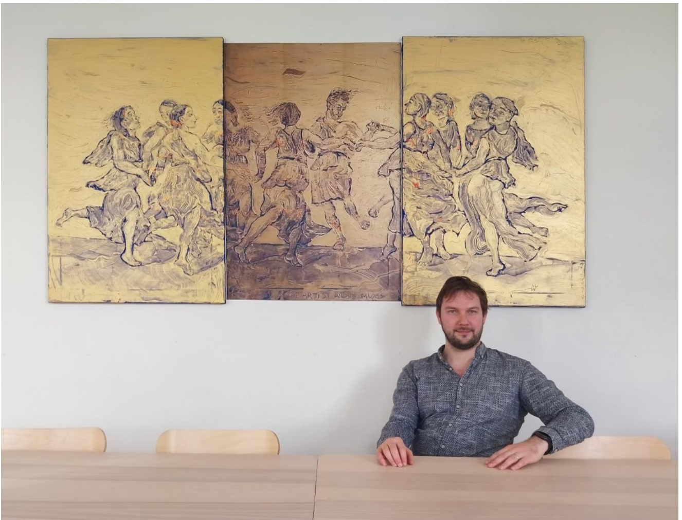
Dagen før udstillingen måtte en udskrift repræsentere det forsvundne midterbillede.

Netop den dag, hvor værket skulle transporteres til VOC Valby, viste det sig også, at planerne igen måtte ændres en smule. Maleriet er et tredelt Triptykon, og dagen før var en af delene pludseligt forsvundet fra dets plads i MatWays kælderrum.