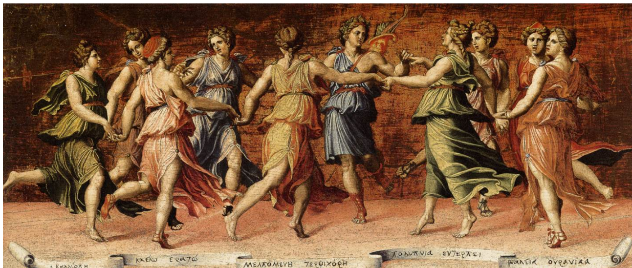
”Apollo and the Muses” (1514-23) af den italienske maler Baldassare Peruzzi.

”The Artist and The Muses” er en fortolkning af Baldassare Peruzzis værk ”Apollo and the Muses” (1514-23). Men hvor Peruzzi benyttede sig af en meget klassisk og naturalistisk stil, er MatWays tilgang mere symbolsk og minimalistisk.